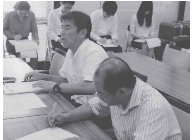
日教組香川執行部

特に、法令遵守では、学校に出退勤記録がなく、この出退勤記録の保存は「労働基準法109条」に書かれている。これがないということは労働基準法違反である。他県では「厚労省ガイドライン」を受けて、出退勤記録を客観的に付けていこうという動きもあり、タイムカードやICカードの導入など進めている。タイムカードやICカードを活用した出退勤記録を保存するよう人事委員会は勧告と報告をすること。