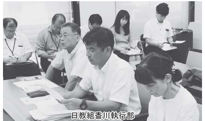
日教組香川執行部

なお、学校事務職員らの時間外勤務には、36協定が必要であることを確認し、全く結べていない現状の改善を報告に明記するよう求めました。