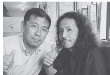
石崎北九州市教組委員長(右)と嶋村日教組香川委員長