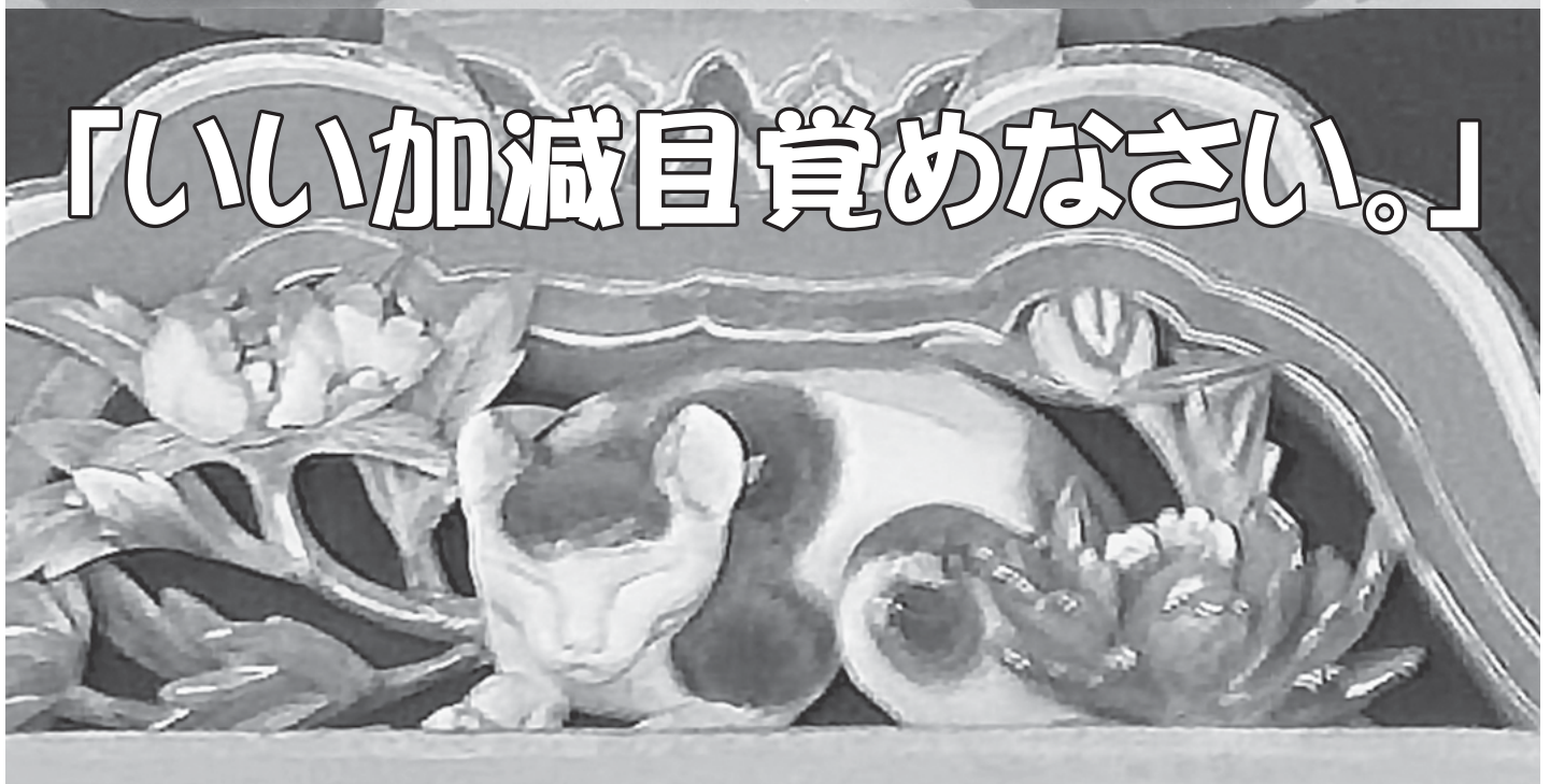
日光東照宮の「三猿」（上）と「眠り猫」（下）

三猿について…「見ざる、言わざる、聞かざる」は「幼少期には悪事を見ない、言わない、聞かない方がいい」という教えであり、転じて「自分に不都合なことは見ない、言わない、聞かない方がいい」という教えにもなる。