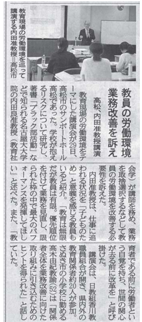
四国新聞にも載りました

ていますので、お一人でもなかまでも、教職員以外の人も参加し、人脈と見識を広げられる“JTUカフェ”にお越しください。日時場所については本誌の裏表紙をご覧ください。