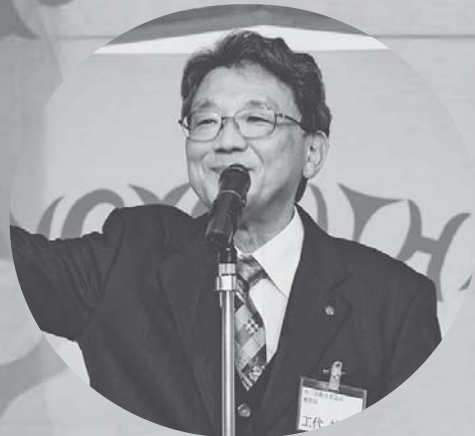
中締めは工代県教育長