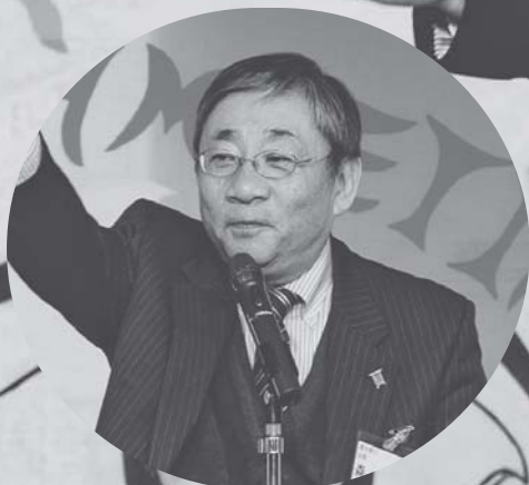
乾杯は森連合香川会長