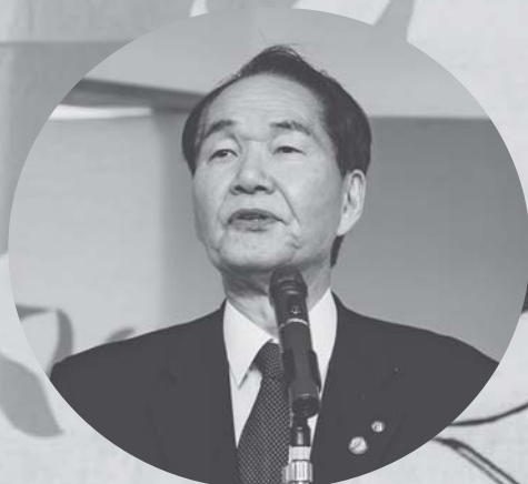
来賓あいさつは浜田県知事