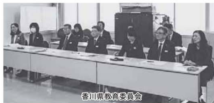
香川県教育委員会

教育長「働き方改革を進めるには、業務改善を思い切った形でやらないとだめだと考えている。時間外勤務が月45時間、年360時間超えて場合どうなるかは、制度が整ってから処分も考えていくことになる」